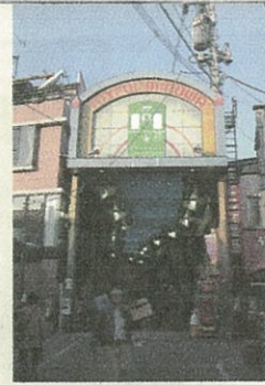
三の輪銀座商店街振興組合 ☎03-3801-1633 www.joyfulminowa.com/